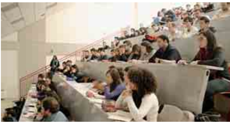
STUDENTI DELLA FACOLTÀ DI INGEGNERIA MENTRE SEGUONO UNA LEZIONE

In questo modo, gli studenti della Kore potranno conseguire sia il titolo di Laurea Magistrale (in classe LM-23) sia il titolo inglese di Master of Science (in CivilEngineering con indirizzo idraulica, ad Exeter, o indirizzo strutture - trasporti, a Newcastle) avendo successivamente la possibilità di esercitare la professione di ingegnere in entrambi i paesi. La scelta del percorso integrato tra Italia e Regno Unito è opzionale per lo studente che può anche scegliere di frequentare l'intero percorso formativo in Italia. Il fatto di avere collegato il nuovo corso di laurea con duepercorsi formativi di Master of Science inglesi potrà assicurare che i risultati di apprendimento del corso in classe LM-23 determinino un percorso che non solo si affianchi a quelli inglesi ma che consenta un'ulteriore specializzazione lungo quel percorso. In particolare, ad