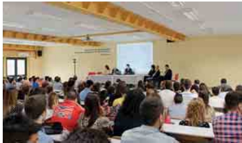
GLI STUDENTI DEL CORSO DI GIURISPRUDENZA

I relatori, in particolare, rifletteranno e si confronteranno sulle questioni inerenti i rapporti di natura personale e di natura patrimoniale fra i conviventi, tanto nella fase fisiologica quanto nella fase patologica. In questo ambito, saranno sottolineate anche le questioni relative ai rapporti con i figli alla luce della riforma della filiazione. Parimenti, saranno trattati gli aspetti relativi allo scioglimento del rapporto o di morte di uno dei due partner. Ampio spazio, infine, sarà dedicato al controverso tema della convivenza omosessuale. In questo quadro, peraltro, particolare attenzione sarà dedicata alla delicata questione del c. d. "divorzio im-