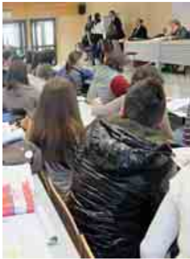
AULA GREMITA DI STUDENTI